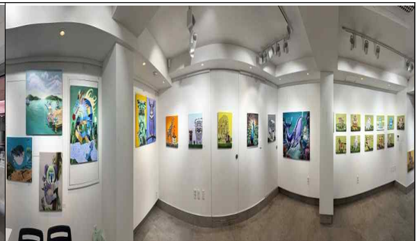
박준수, 개인展 '행복의 공간'